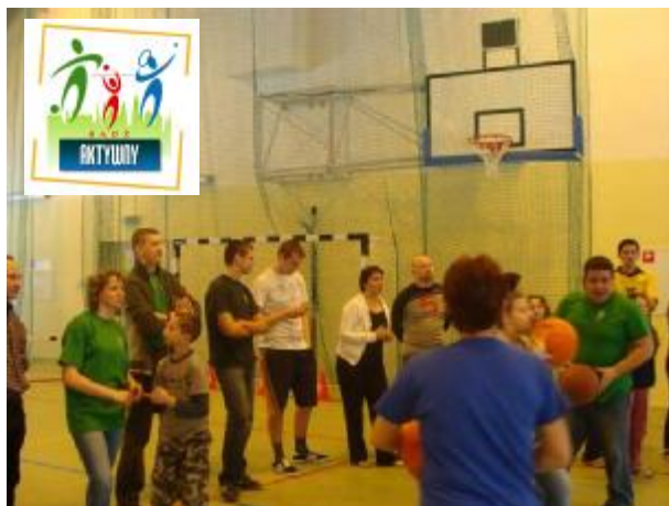
Bądź Aktywny – Piknik Wiosenny