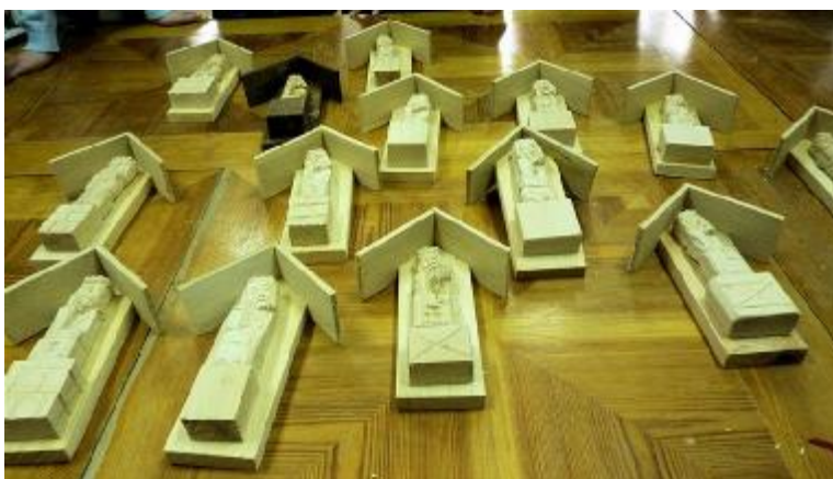
Warsztaty rzeźbiarskie w Wigierskim Parku Narodowym