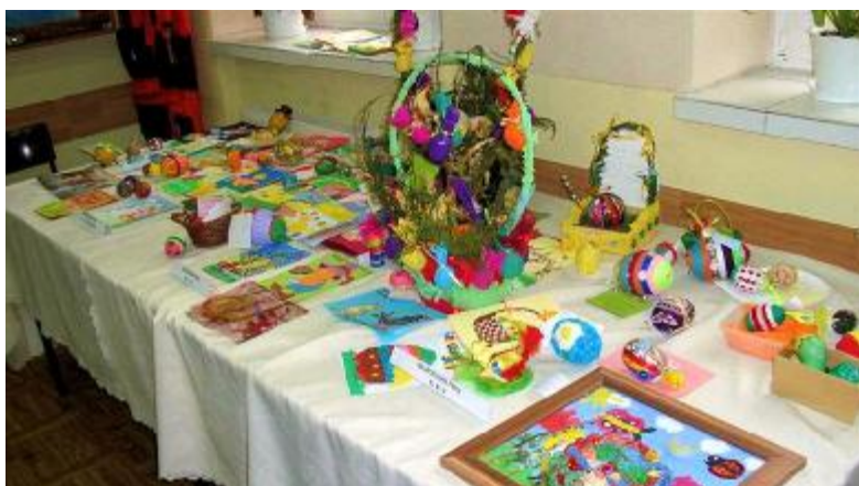
Konkurs Wielkanocny – prace Konkurs „Program Operacyjny >>> Kapitał Ludzki Twoją Szansą”