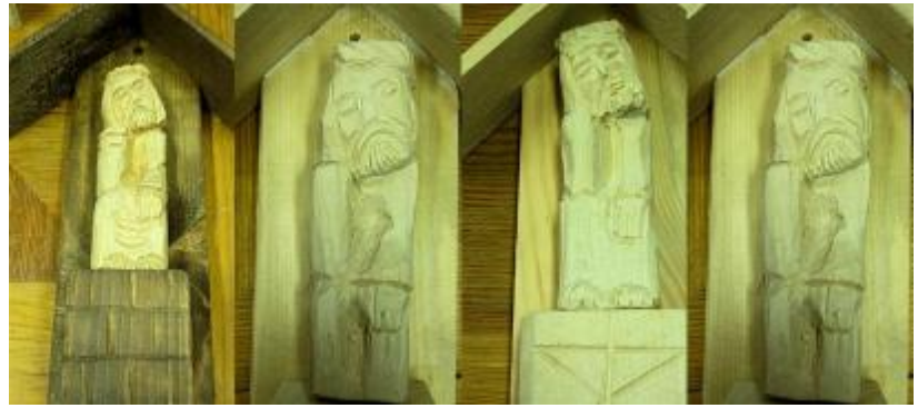
Prace naszych gimnazjalistów wykonane podczas warsztatów rzeźbiarskich w WPN.